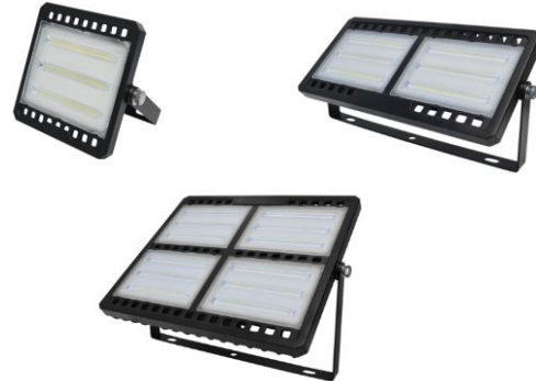
Foto van het product

Shada B.V. Kanaal Noord 350 7232-AM Apeldoorn